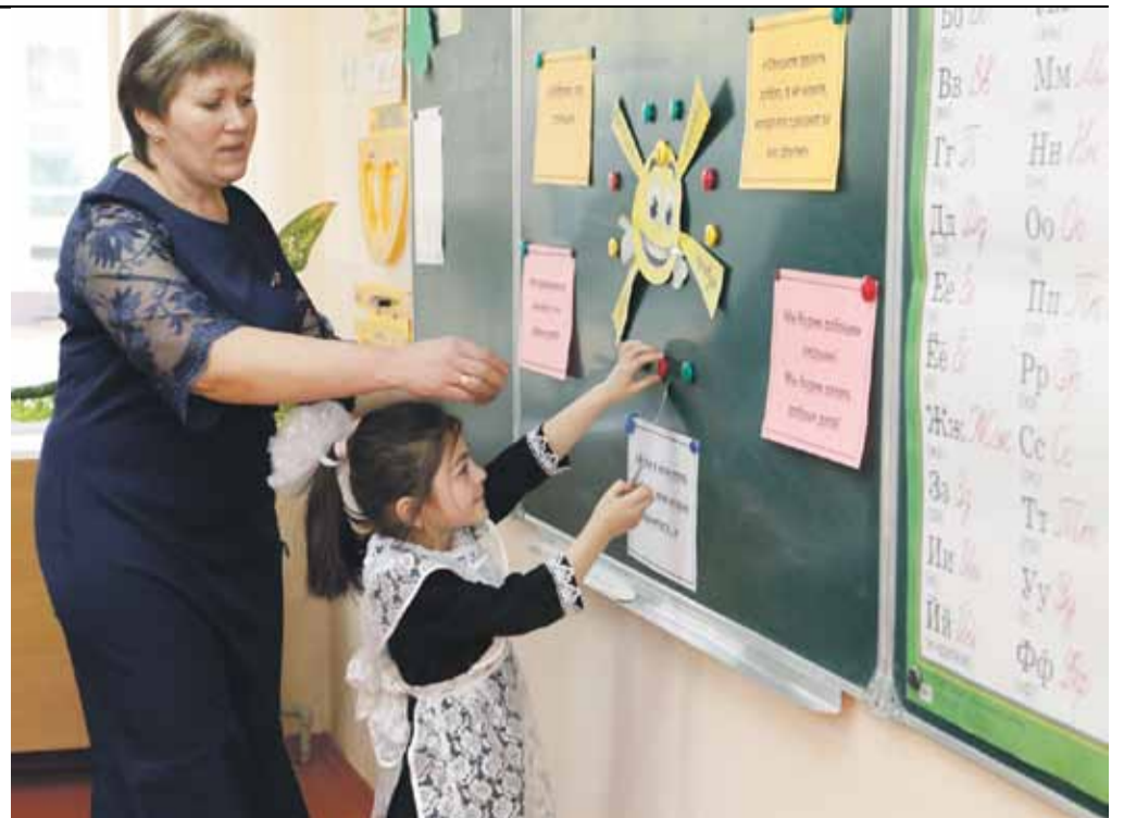
Урок в начальной школе села Степное