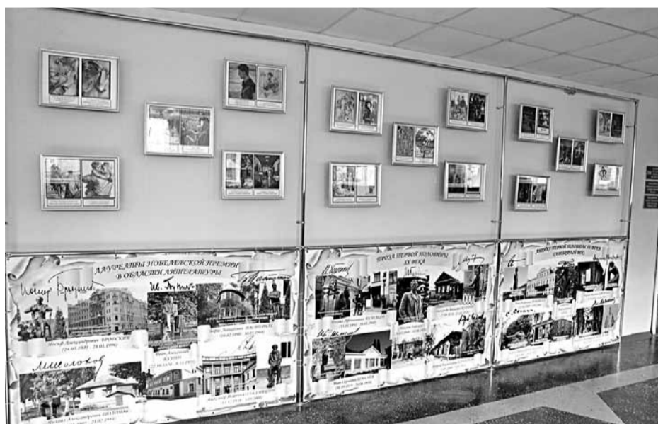
Образовательная зона лицейского литературного музея

На классных часах учителя рассказывают школьникам о способах применения бережливых инструментов на личном рабочем месте. Для