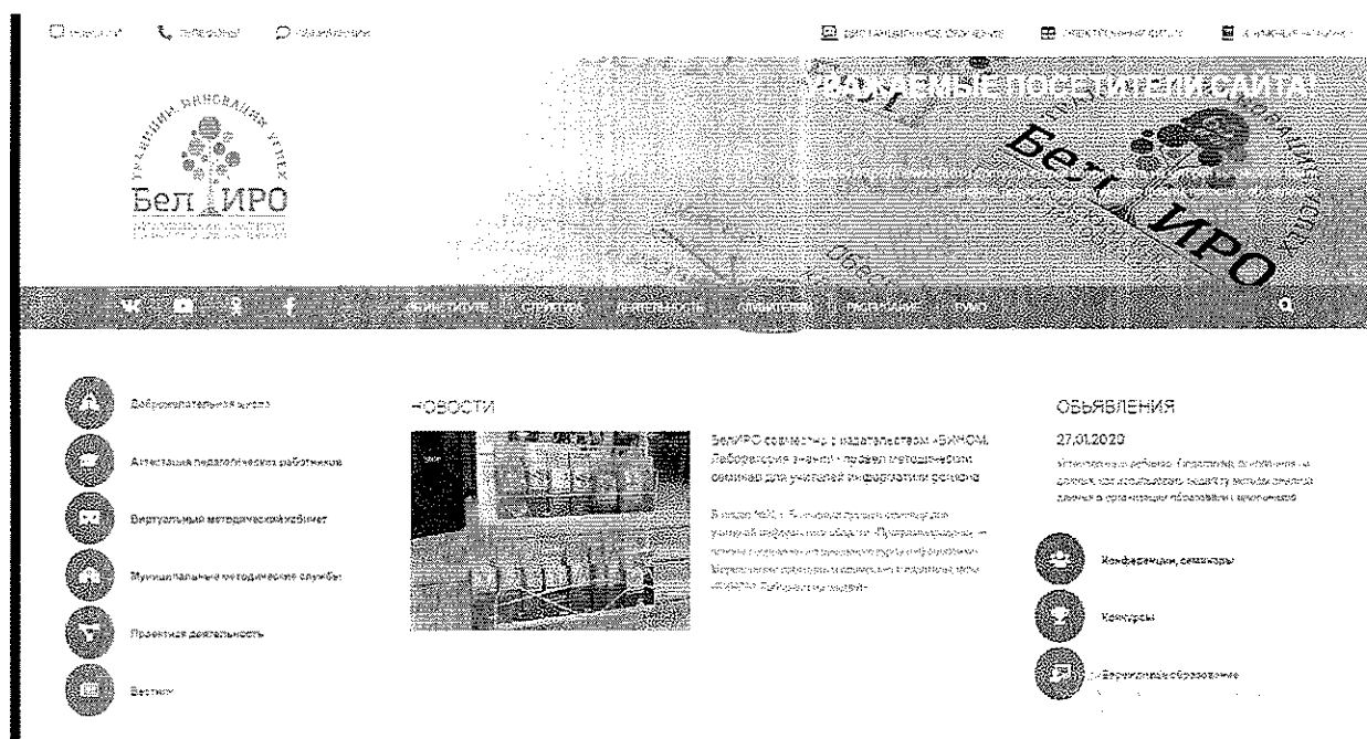
Рис.1 Раздел «Слушателям»

2. Оплатить организационный взнос, используя услуги банка, онлайн версии услуг банка или мобильный телефон, указав следующую информацию: