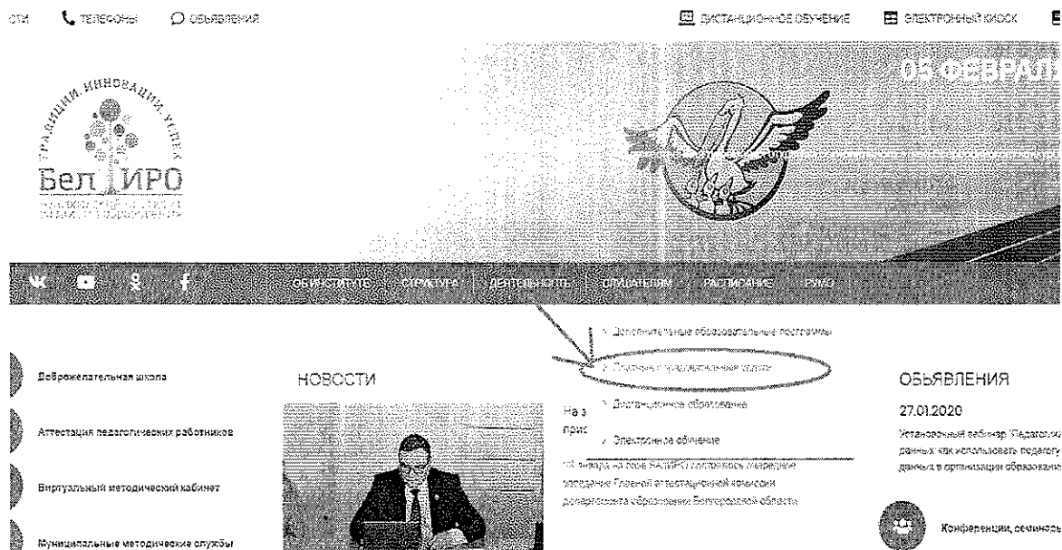
Рис.2 Раздел «Платные образовательные услуги»