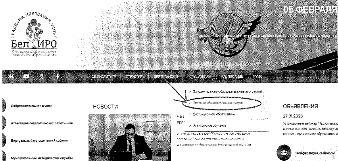
Рис.2 Раздел «Платные образовательные услуги»