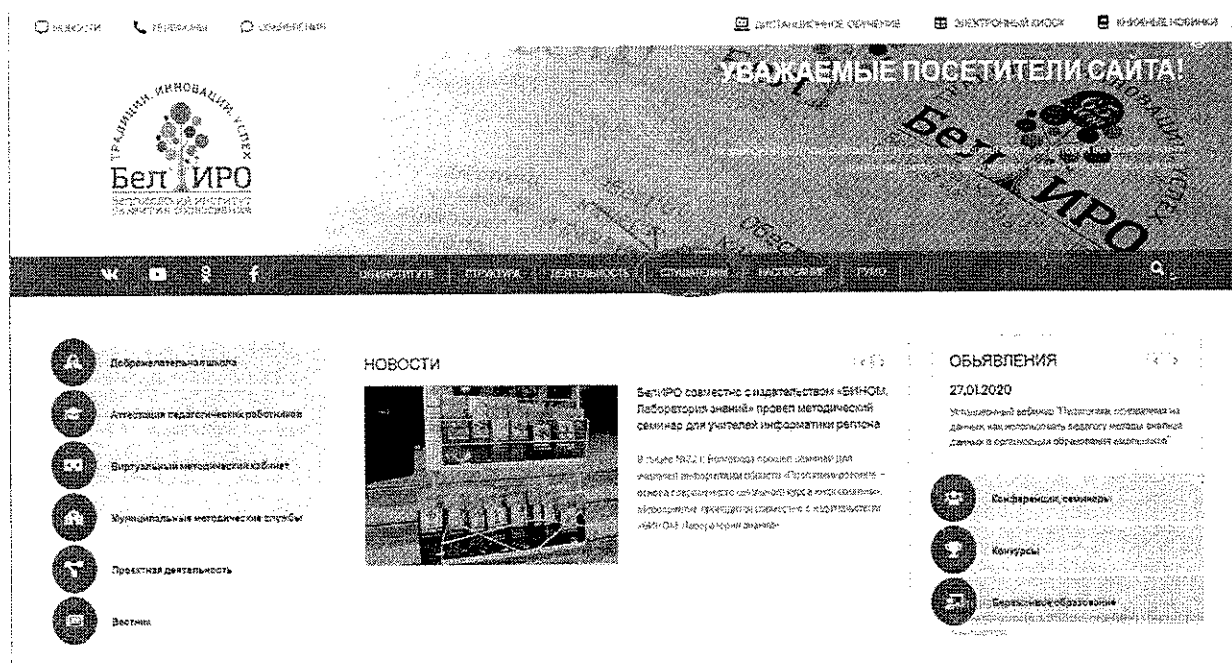
Рис.1 Раздел «Слушателям»

2. Оплатить организационный взнос, используя услуги банка, онлайн версии услуг банка или мобильный телефон, указав следующую информацию: