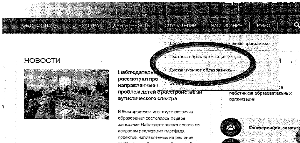
Рис.2 Раздел «Платные образовательные услуги»