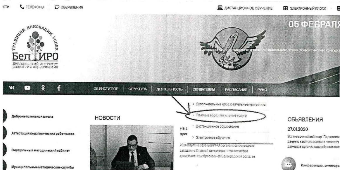
Рис.2 Раздел «Платные образовательные услуги»