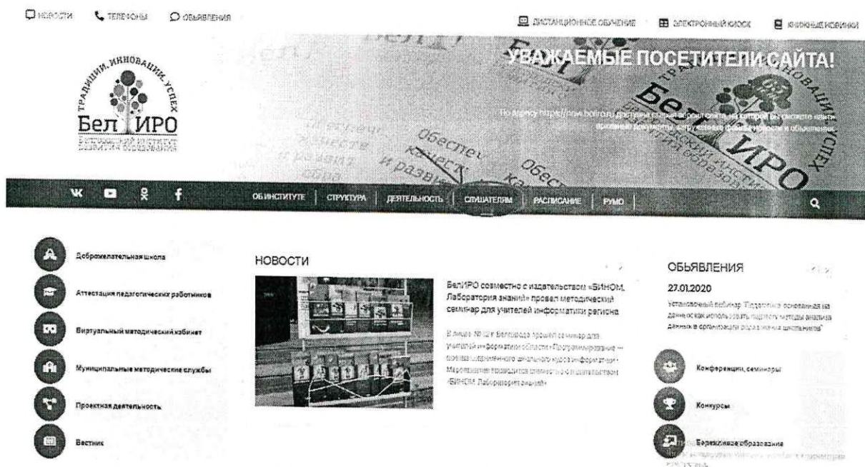
Рис.1 Раздел «Слушателям»