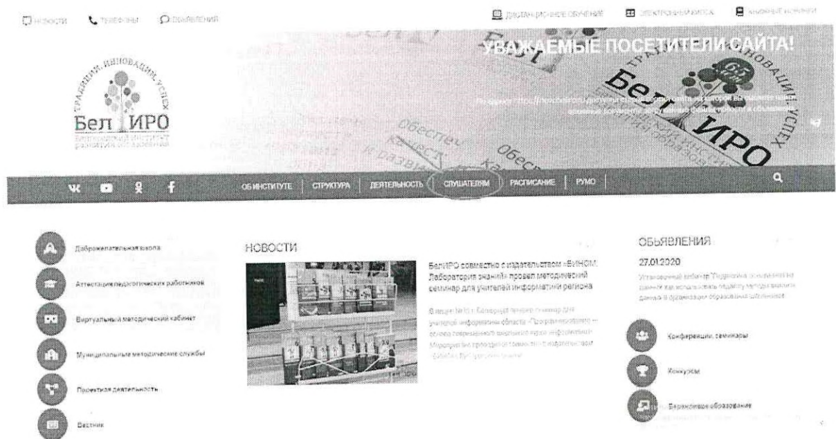
Рис.1 Раздел «Слушателям»