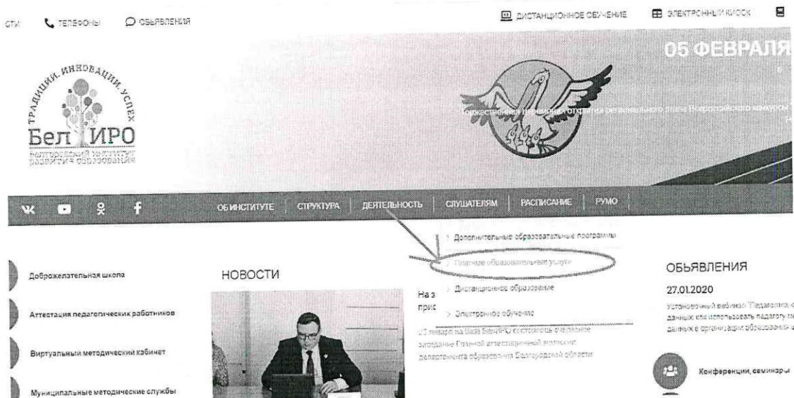
Рис.2 Раздел «Платные образовательные услуги»