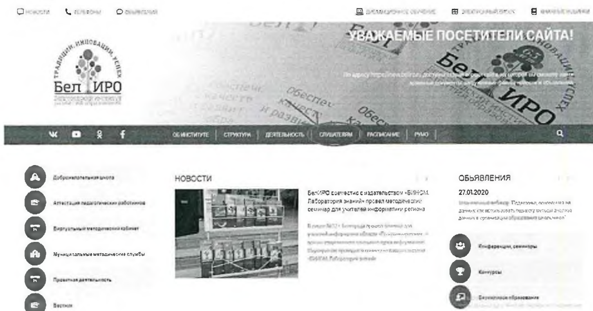
Рис.1 Раздел «Слушателям»