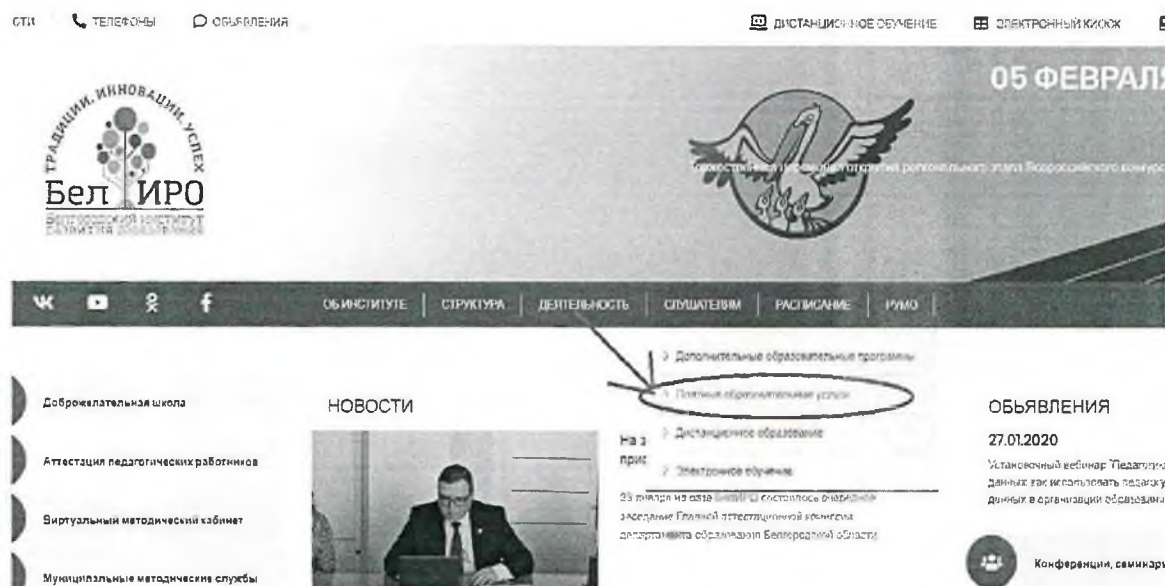
Рис.2 Раздел «Платные образовательные услуги»