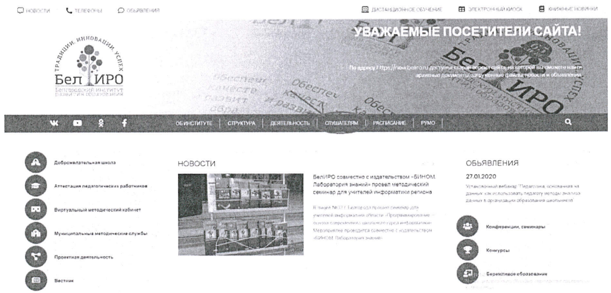
Рис.1 Раздел «Слушателям»