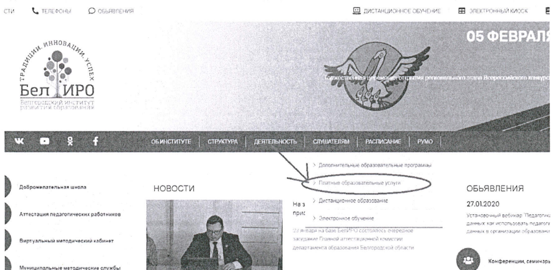
Рис.2 Раздел «Платные образовательные услуги»