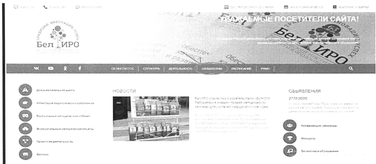
Рис.1 Раздел «Слушателям»